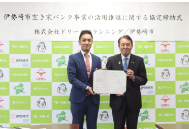
《2023年伊勢崎市市長と写真撮影》